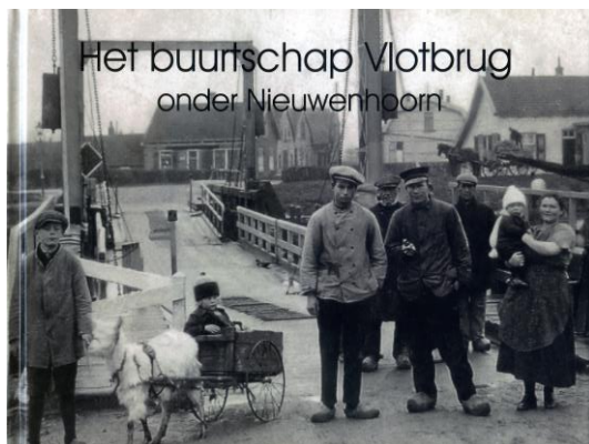
Het Buurtschap Vlotbrug

Het Stedsmuseum is de schenkers – veelal (oud-) Hellevoeters – dan ook dankbaar voor deze schenkingen.